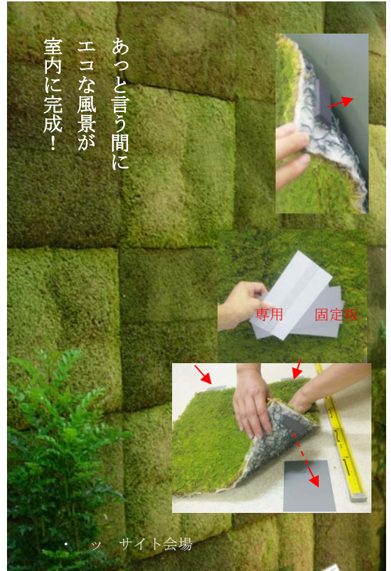
モスフェース 部材 専用固定板

http://www.moss-net.jp http://www.moss-net.jp/html/in_form.htm