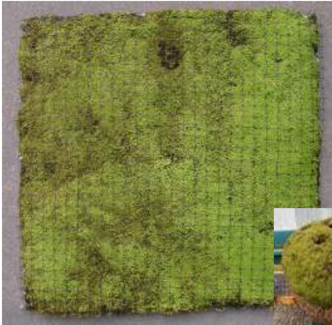
モスフラット生苔版