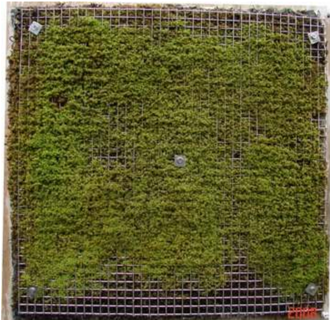
苔専用素焼きポットに 特性接着糊による固定化