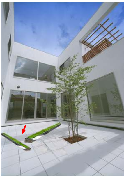
モニター ジュ画像